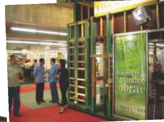
Inovação no stand: todo construído com as formas estruturais foi a grande vedete da feira.

A IV Feira Internacional de Materiais, Equipamentos e Serviços da Construção FICONS 2004, foi palco do lançamento de uma inovação tecnológica desenvolvida pela FORMATEC - um novo sistema de travamento de viga - e da demonstração de um manual de montagem da forma estrutural.